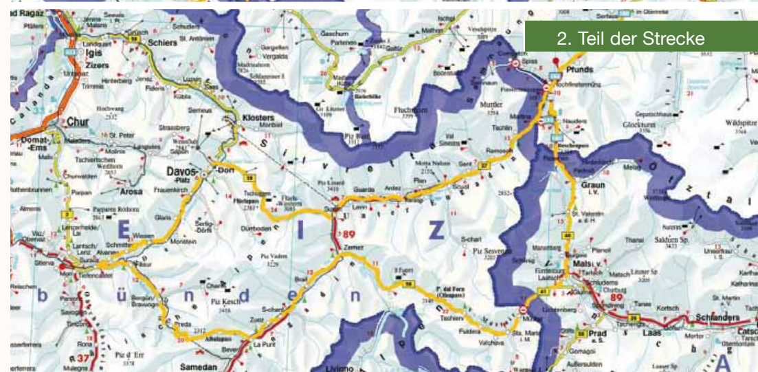
2. Teil der Strecke