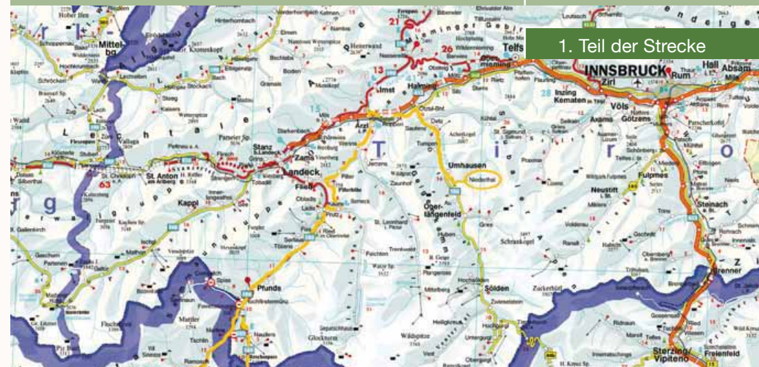
1. Teil der Strecke